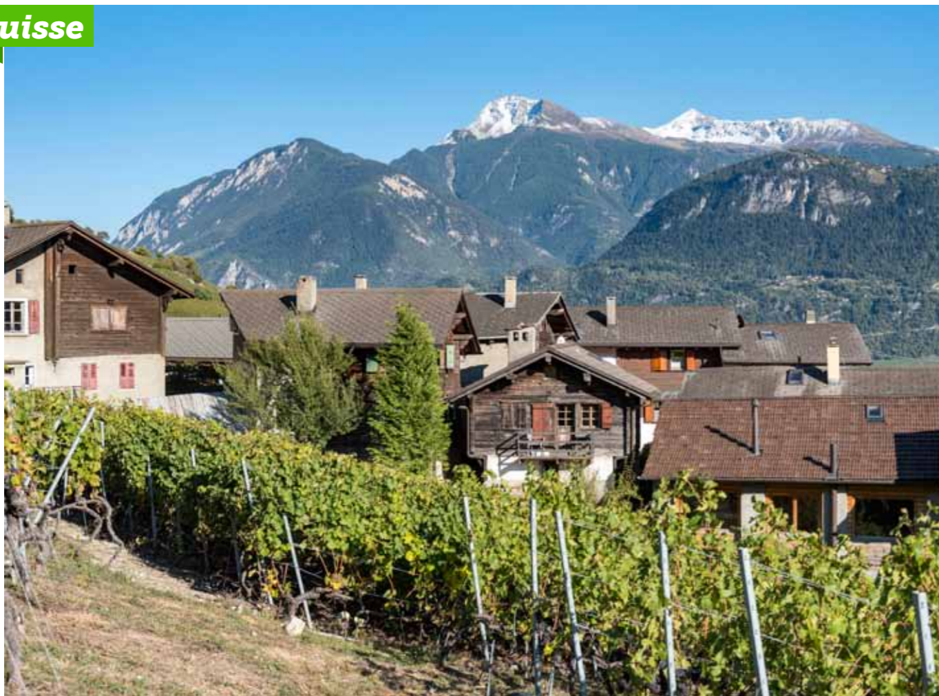
Le hameau de Saint-Clément, situé à 600 m d'altitude et niché au cœur des vignes, est l'un des neuf villages de la commune de Lens.

→ sans orchestre, c'est ennuyeux, alors les plus jeunes en forment un nouveau. Lorsque les musiciens de la première fanfare reviennent, ils reprennent leurs instruments et leur fanfare. Un village avec deux fanfares n'est pas concevable, mais aucune ne veut se saborder. Elles se livrent donc à une compétition féroce