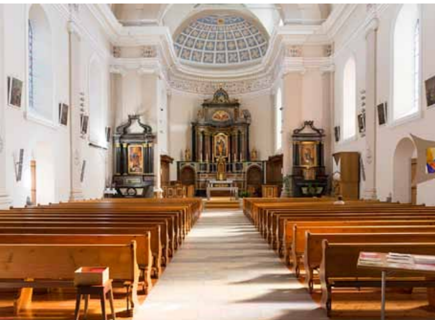
L'actuelle église de Lens, construite 1843-45, a connu depuis deux restaurations, une en 1907 et la dernière en 1975-76. Son intérieur est d'une grande unité et d'une sobriété respectée par les restaurateurs.

qui va semer la zizanie. D'un côté, il y a les « blancs », qui soutiennent la fanfare aux instruments argentés, l'ancienne Cécilia, et de l'autre les « jaunes », qui défendent celle aux instruments dorés, la Cécilia. Le village se divise en deux clans, deux partis de famille... donc deux épiceries, deux banques, deux cafés. « Mes parents étaient "blancs", donc il n'était pas question d'aller à l'anniversaire d'un "jaune" », se souvient cet habitant. « De même, un "jaune" ou un "blanc" qui faisait des affaires avec l'autre clan était vu comme un traître, il devait changer de camp! » Depuis quelques années, cette rivalité s'estompe mais elle ne fut pas stérile. En se tirant la bourre, les musiciens de Chermignon ont atteint un très haut niveau: le Valaisia Brass Band – dont le directeur et la majorité des musiciens sont issus de l'ancienne Cécilia et de la Cécilia – rafle presque tous les titres nationaux et internationaux. Après un siècle, les deux fanfares ont enfin trouvé leur place ici, comme les vignes et les randonneurs. ●